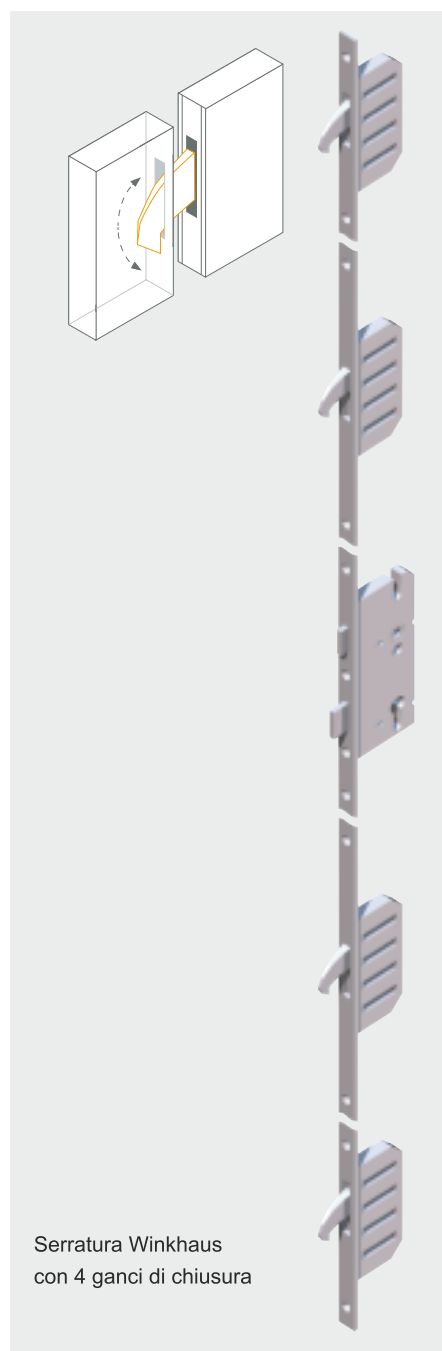
Serratura Winkhaus con 4 ganci di chiusura

Le serrature a più punti sono una soluzione moderna, in grado di proteggere efficacemente dalle effrazioni. Nelle porte BlueLine Premium viene utilizzata la serratura hookLock della Winkhaus, con 4 ganci di chiusura aggiuntivi. Questa soluzione, garantisce la massima sicurezza ed un elevato comfort di utilizzo della porta.